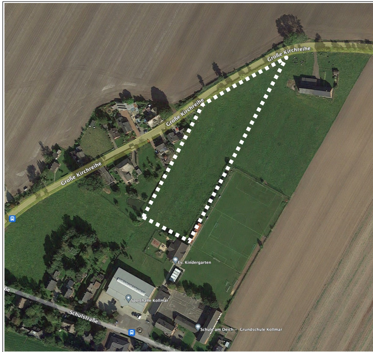
Abb.: Ausschnitt Luftbild mit Kennzeichnung des Plangebietes