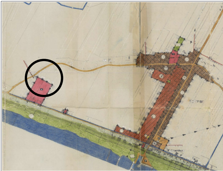
Abb.: Ausschnitt Flächennutzungsplan mit Kennzeichnung der Lage des Plangebietes